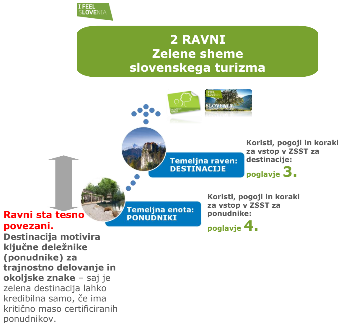
Shema št. 1: Prikaz dveh ravni delovanja ZSST